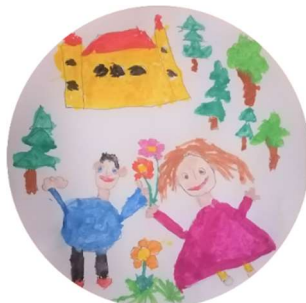
Logotip Vrtca Podčetrtek

Pomočnica ravnateljice za vrtec Urška Sovinc