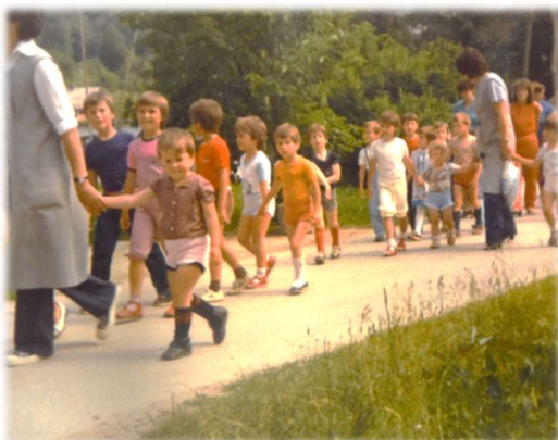
Orientacijski pohod s starši