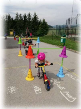
Projekt Mali sonček