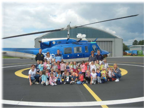
Obisk letališča v Mariboru