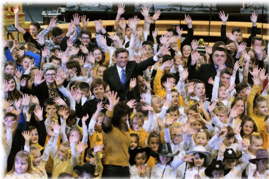
Dobrodelni koncert z udeležbo predsednika Boruta Pahorja