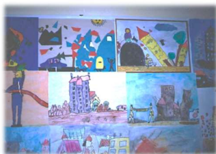
Sodelovanje na likovnem natečaju »Potres«