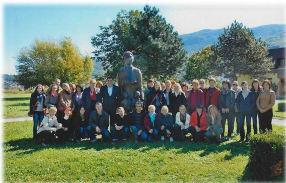
Strokovna ekskurzija v Lepoglavo