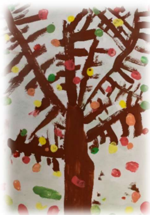
Mi smo drevo z veliko krošnjo

S sodelavci prihajamo v službo nasmejani, razigrani in čuteči. Delimo nežne objeme in tople besede, hkrati pa skrbimo za nenehno učenje, s katerimi bomo uvajali spremembe, ki jih od nas pričakuje današnji čas. Vsak od nas je pomemben in vsak dodaja svoj delež h krošnji drevesa, katera je pričela rasti v letu 1972.