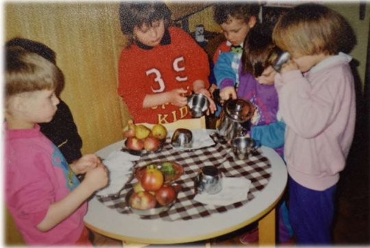
Uvedba prehranjevalnega kotička v vrtcu