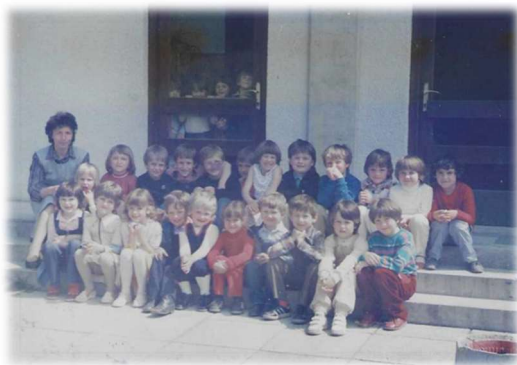
Številčen oddelek starejših otrok