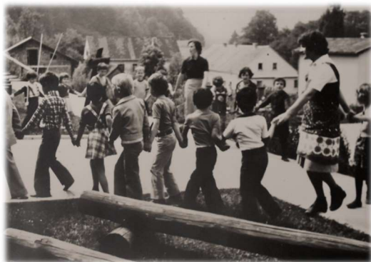
Rajanje otrok na Cicibanovi štafeti