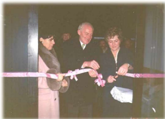
Slavnostna otvoritev vrtca