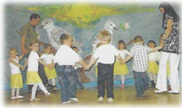
Nastop najmlajših otrok na dobrodelni prireditvi