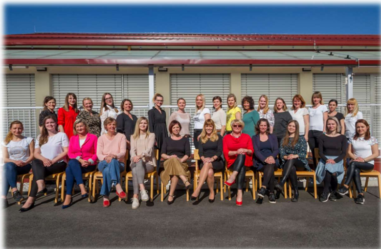
Strokovni delavci v šolskem letu 2021/2022

Vseh 40,75 zaposlenih skupaj vsak delovni dan poskrbimo, da vrtec je varen, prijazen, igriv, nahranjen in čist.