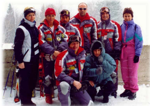
Učitelji smučanja in strokovne delavke prve zimske šole v naravi