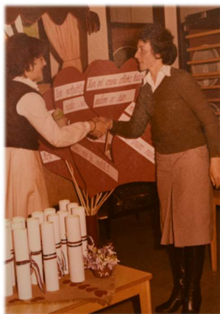
Podelitev priznanja OZS TOZD