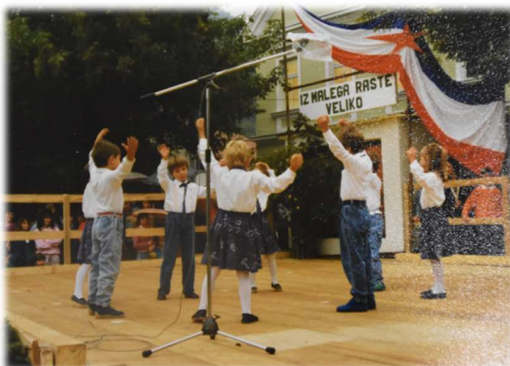
Plesni nastop otrok ob prazniku občine