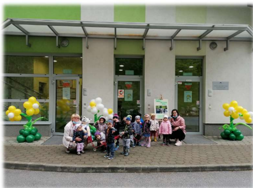
Praznovanje 10. obletnice v novih prostorih vrtca