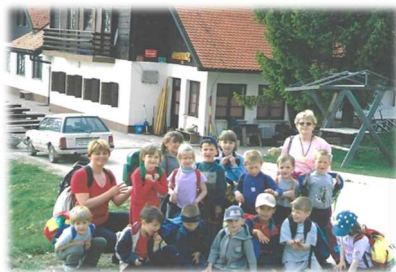
Planinski pohod na Bohor