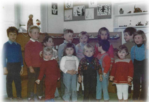
Prva generacija Vrtca Podčetrtek