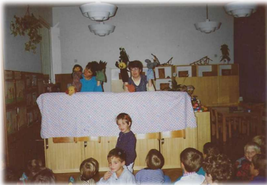
Otroci med ogledom lutkovne predstave