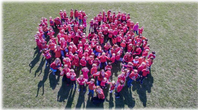
Majhni smo, a kaj zato? V srcu smo veliki!

V letošnjem šolskem letu so se otroci spoznali s himno, jo vzeli za svojo in jo radi prepevajo.