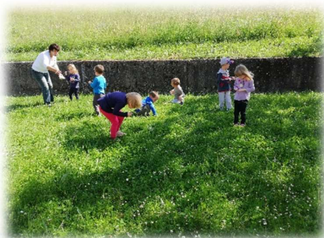
Raziskovanje na travniku