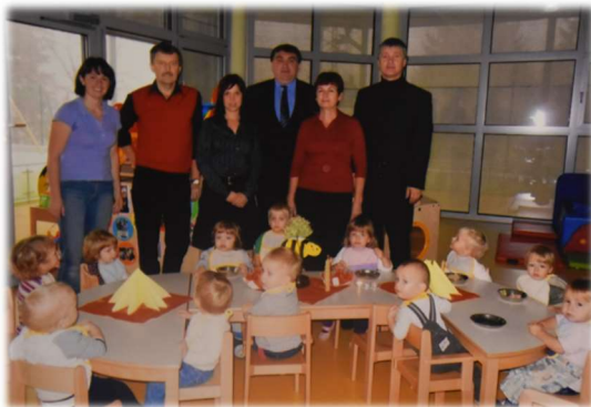
Obisk pri najmlajših v času tradicionalnega medenega zajtrka