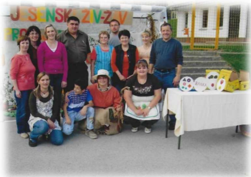
Zaposleni skupaj z županom na jesenskem Živ-žavu