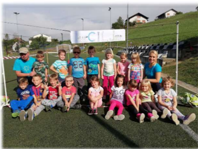
Udeležba otrok na množičnem teku