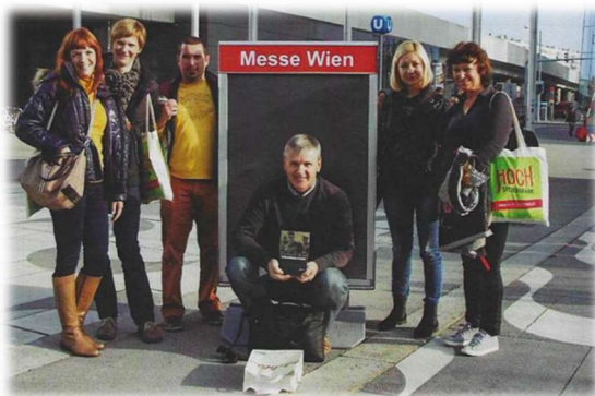
Strokovni delavci na mednarodnem sejmu Interpedagogike