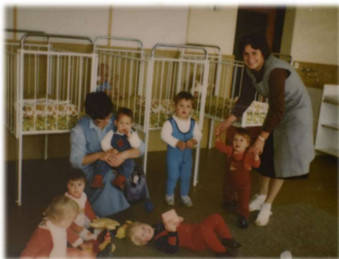
Odprtje novega jasličnega oddenka