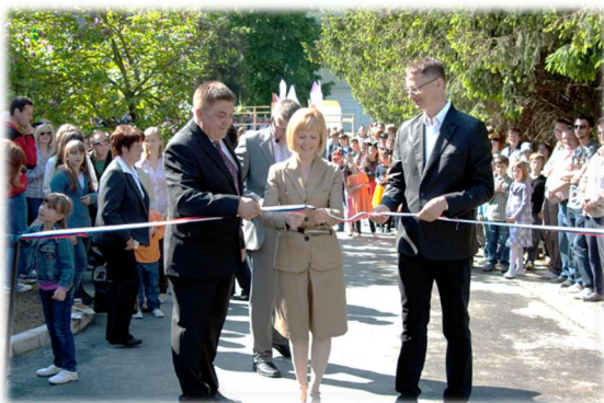
Otvoritev novih prostorov vrtca v Podčetrtku