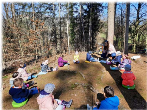
Poslušanje pravljice v gozdu