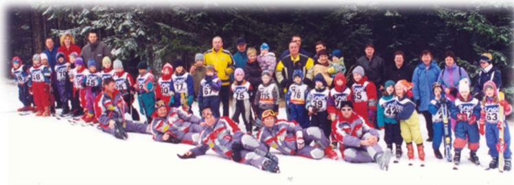
Vsi udeleženci prve zimske šole v naravi