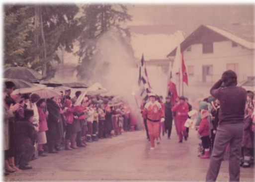
Sprejem olimpijskega ognja