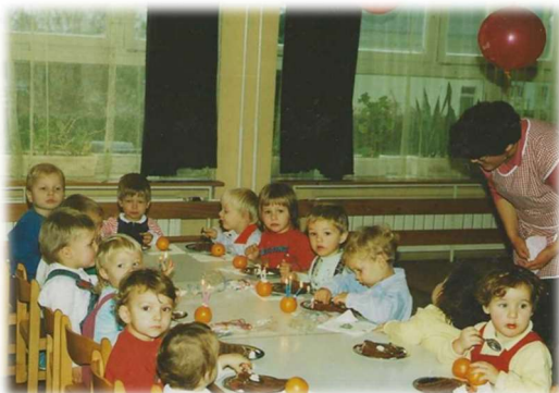
Praznovanje rojstnega dne