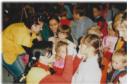
Otroci so postali Pika nogavička za en dan