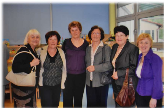
Prve strokovne delavke v vrtcu Podčetrtek