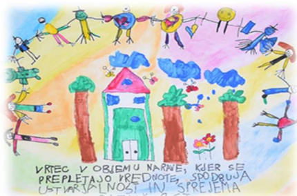
Vizija vrtca skozi otroške oči

“Vrtec v objemu narave, kjer se prepletajo vrednote, spodbuja ustvarjalnost in sprejema različnost.”