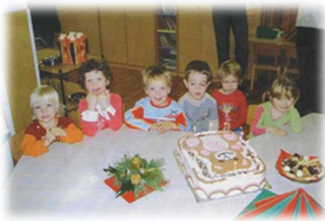
Praznovanje 10. obletnice delovanja vrtca