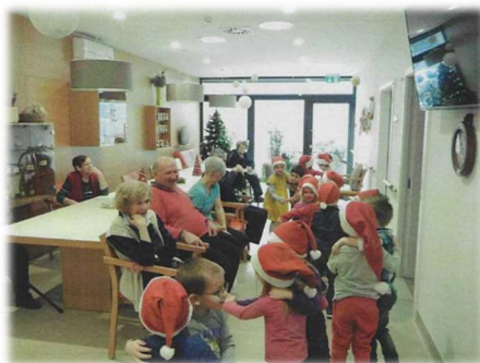
Nastop za starejše občane v domu upokojencev