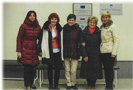
Obisk ravnateljic v Vrtcu Podčetrtek