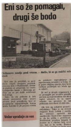
Prispevek v časopisu ob odprtju novega prizidka