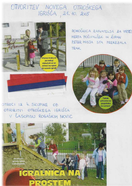
Otvoritev novega otroškega igrišča v Podčetrtku