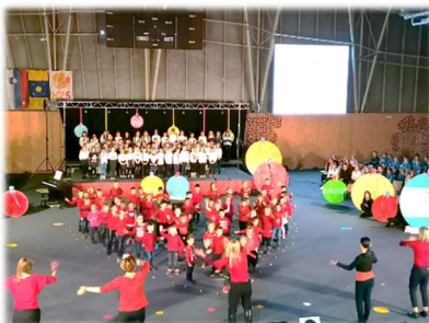
Nastop otrok na dobrodelni prireditvi