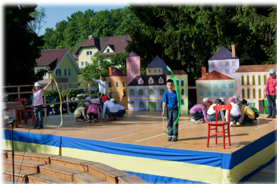
Nastop najmlajših ob otvoritvi novih prostorov