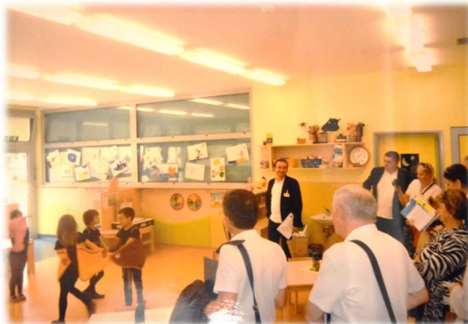
Nastop ob obisku komisije Entente Florale Europe