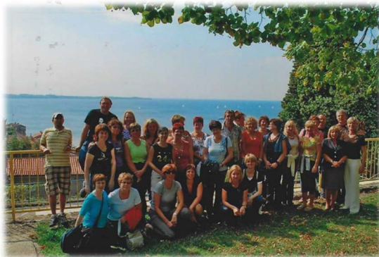
Strokovna ekskurzija zaposlenih v Piran